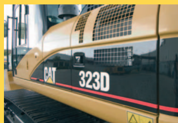
323D LN 319D LN